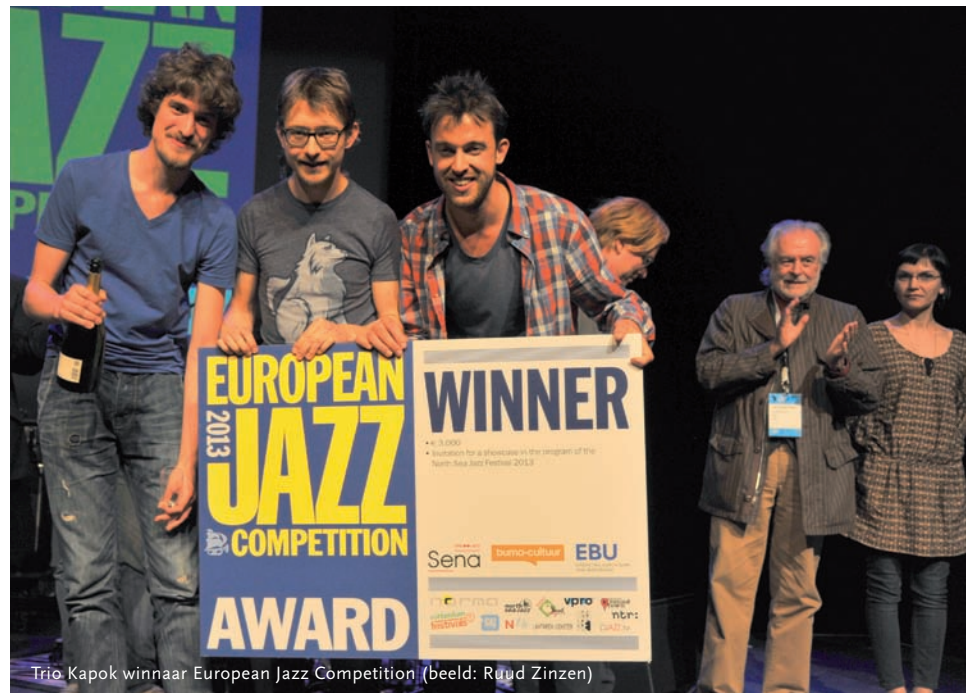
Trio Kapok winnaar European Jazz Competition

Zaterdagmiddag was er een besloten matchmakingslunch, georganiseerd voor een buitenlandse delegatie van festivalprogrammeurs en producers van jazzradiozenders