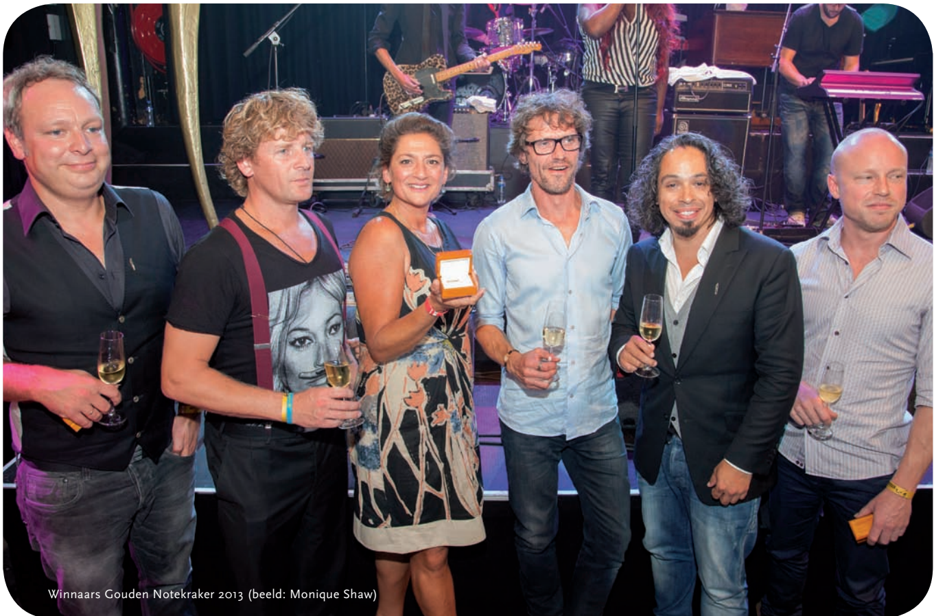
Winnaars Gouden Notekraker 2013