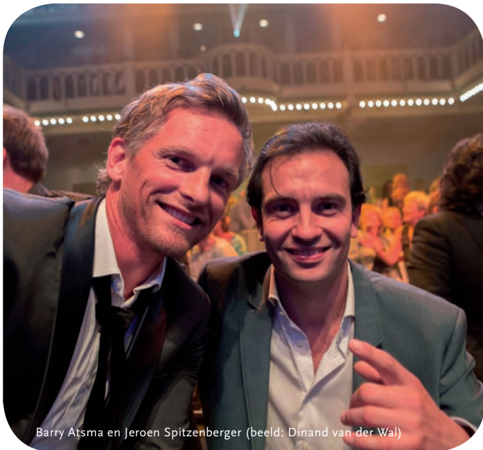
Barry Atsma en Jeroen Spitzenberger