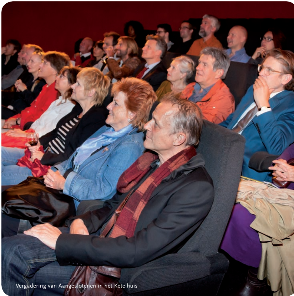
Vergadering van Aangeslotenen in het Ketelhuis