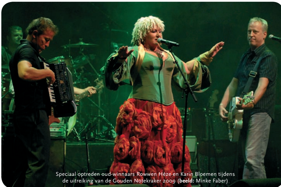
Speciaal optreden oud-winnaars Rowwen Hèze en Karin Bloemen tijdens de uitreiking van de Gouden Notekraker 2009 (beeld: Minke Faber)

Dat heeft misschien ook te maken met het beeld van de podiumkunsten dat de over-