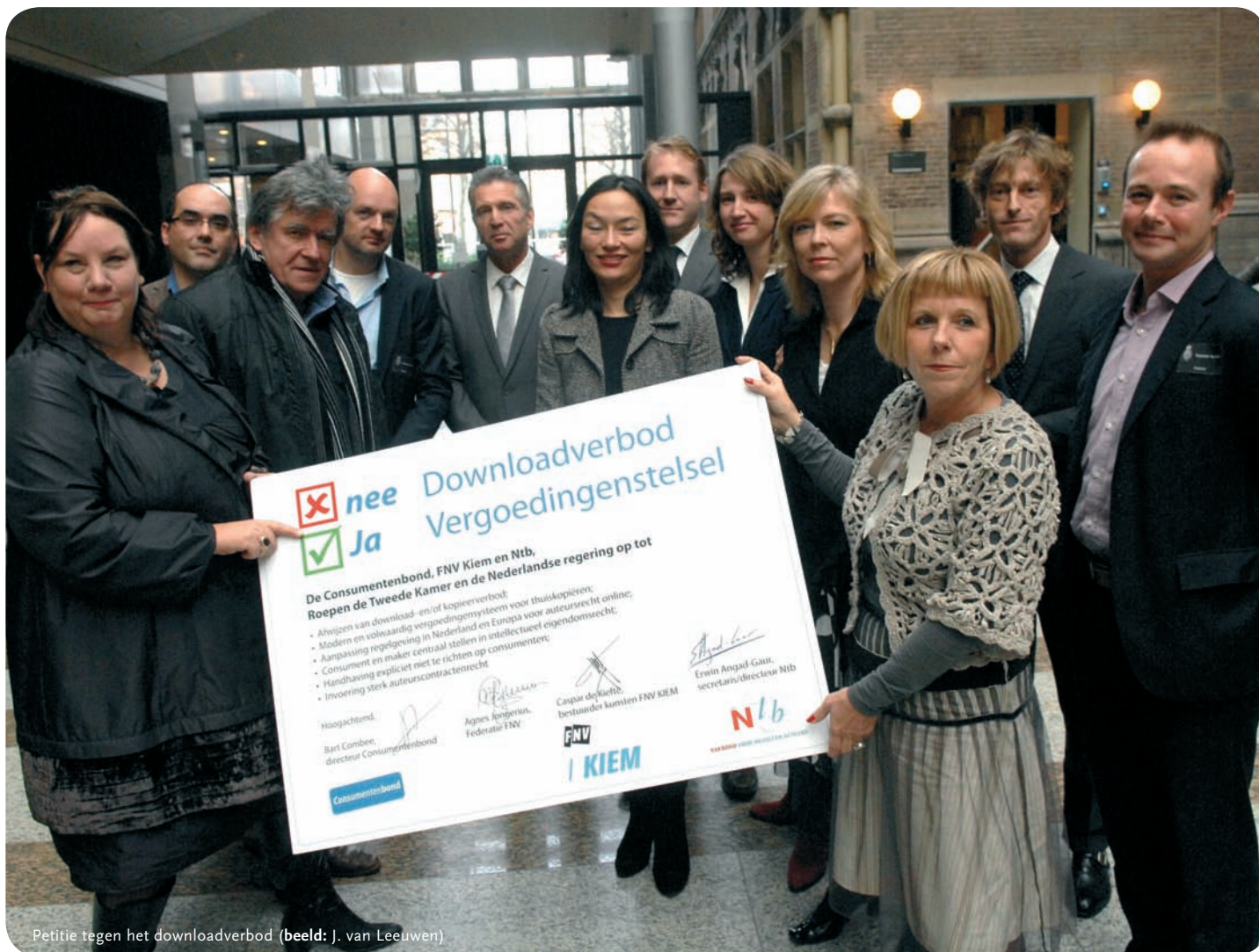
Petitie tegen het downloadverbod

Bozkurt (PvdA) heeft namelijk vorig jaar aan de Europese Commissie de vraag voorgelegd in hoeverre de Nederlandse plannen tot afschaffing van het thuis kopiëerstelsel in overeenstemming zijn met Europese regelgeving. Begin dit jaar heeft de verantwoordelijke euro-